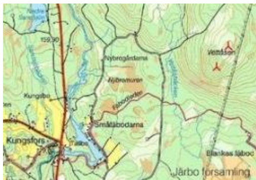
Karta över Vettåsen.

Hudikvind är delägare i följande anläggningar: