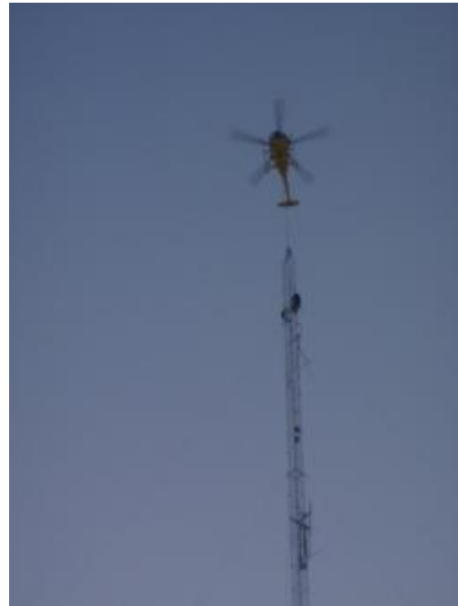
Montage av vindmast vid Högkölen

En kungörelse av tillståndsansökan inklusive miljökonsekvensbeskrivning skedde den 11 november 2011. Handlingarna finns tillgängliga hos Länsstyrelsen (dnr 551-5271-11) samt hos Gävle kommuns Medborgarkontor.