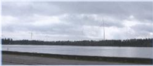
Fotomontage i Ljusne.

Hudikvind är delägare i följande projekt: